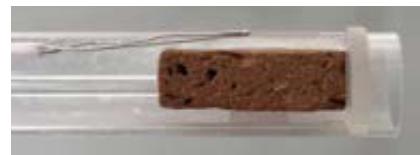
1 Probenkörper aus rotem gebranntem Ton im Quarzglas-Probenhalter

Der in dieser Studie verwendete Probenkörper besteht aus frischem, unverwittertem, gebranntem roten Ton einer bestimmten archäologischen Fundstätte, präpariert als Quader mit regelmäßigem Querschnitt und einer Länge von etwa 25 mm. Die Untersuchungen wurden mit einem NETZSCH-Dilatometer DIL 402 Expedis ® Classic durchgeführt.